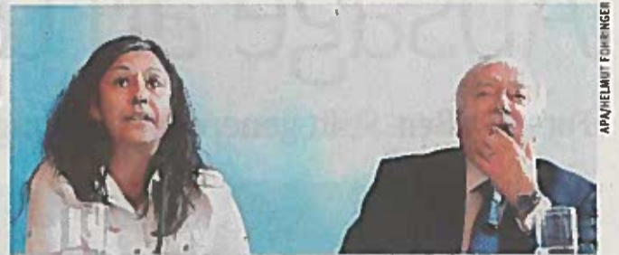
Vassilakou und Häupl verhandeln jetzt die besonders heiklen Punkte

Das rot-grüne Feilschen um eine Neuauflage der Koalition geht in die entscheidende Phase. In den Untergruppen, die sich mit den einzelnen Fachthemen beschäftigt haben, seien die Gespräche de facto abgeschlossen, ist aus Verhandlerkreisen zu hören. Alle Streitpunkte, die dort nicht ausgeräumt werden konnten, werden jetzt in großer Runde mit Bürgermeister Michael Häupl und Vizebürgermeisterin Maria Vassilakou verhandelt. Das erste dieser Treffen fand Montagmittag statt.